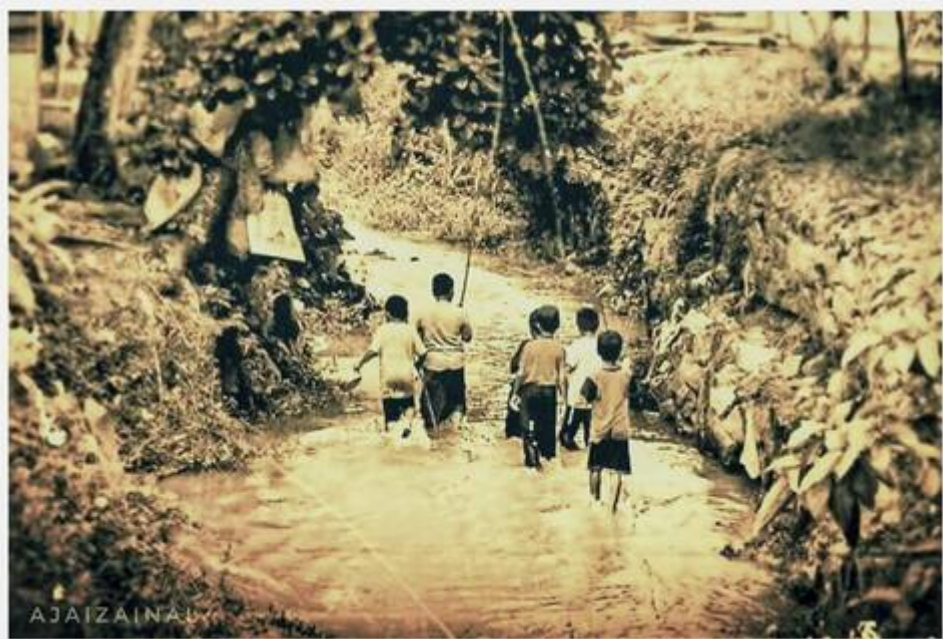
Kiri: Anak-anak menjelajah Sungai Bangi (Faizal Hj Zainal, September 14, 2008: