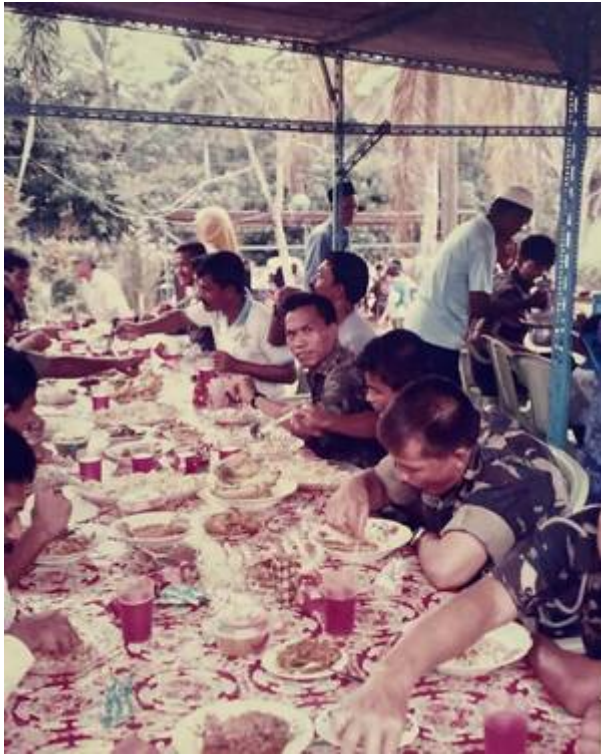
"Dulu-dulu punya makan kenduri makan berhidang tau.. Punya la meriah.. Tapi angkatan rewang memang cergas ☐☐ Satu kampung bergotong-royong. Gambar ehsan Abg Noor Komando" (Facebook Pekan Bangi, 27 Januari 2025: " Gambar ehsan Abg Noor Komando ").