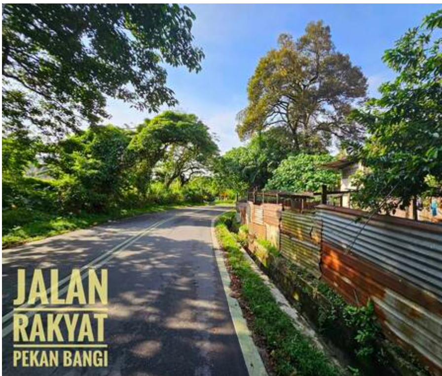
"Jalan Rakyat", menghubungkan Pekan Bangi dengan Masjid Bangi: "Mungkin dah nak capai usia 30 tahun jalan ini dibina oleh rakyat Bangi. Ada satu towkey otai Bangi ni setiap kali saya berjumpa