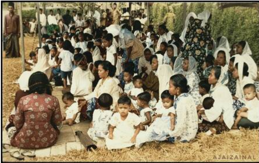
"Maulud Nabi Di Bangi 1957" ( Kiri: Gambar asal. Kanan: Gambar diperbaiki).