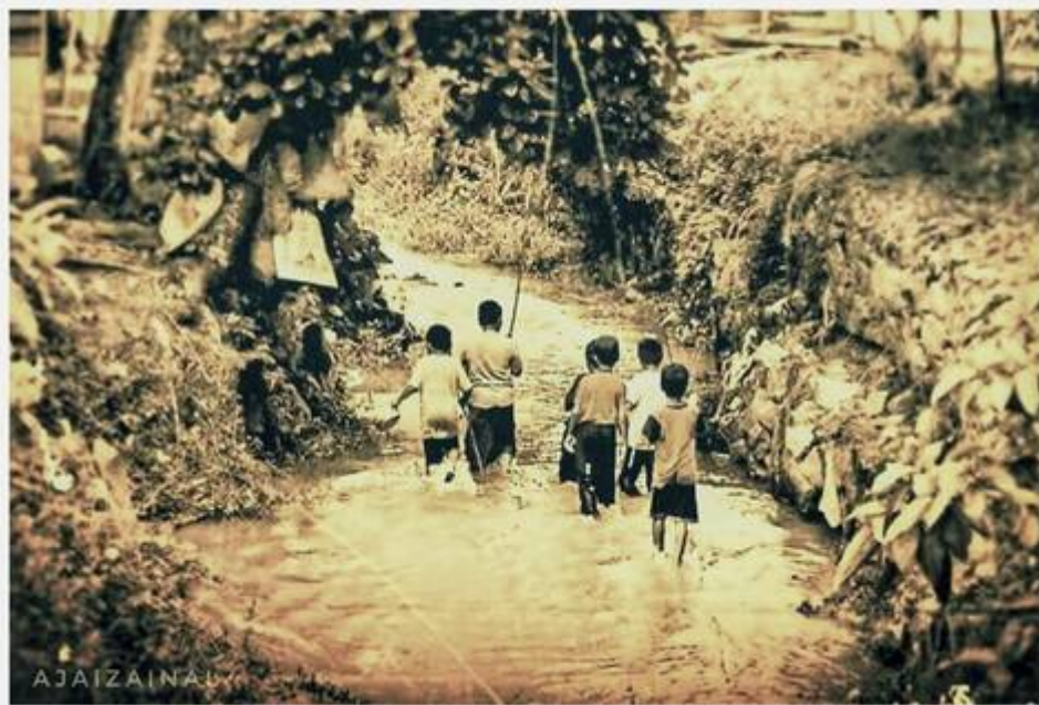
Kiri: Anak-anak menjelajah Sungai Bangi (Faizal Hj Zainal, September 14, 2008: