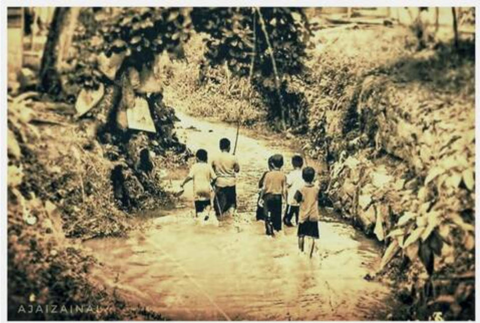
Kiri: Anak-anak menjelajah Sungai Bangi (Faizal Hj Zainal, September 14, 2008: