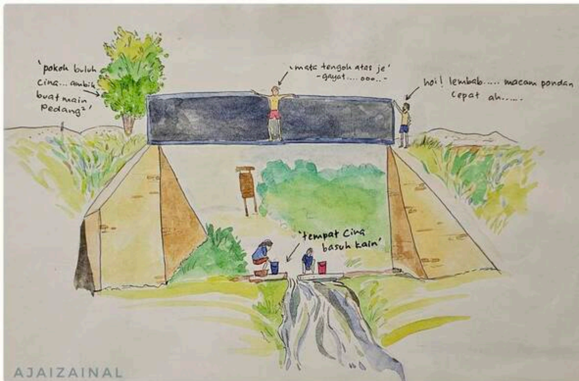
“Jambatan Hitam Sungai Bangi”

“Masa kecil - kecil dulu kitaorang akan buat ujian keberanian menyeberang jambatan dari sisi jambatan keretapi ni dan jugak kena terjun ke bawah untuk buktikan kita ni bukan pondan. Kalau dulu - dulu dipanggil pondan memang malu betul...jadi memang semua sanggup terjun ke sungai walaupun banyak batu asalkan tak menanggung sakit hati dan malu dipanggil pondan. ilustrasi kartun - ajaizainal 1998”