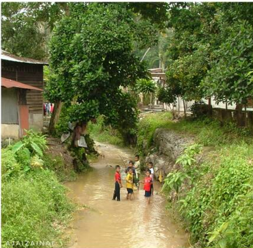
"Budak - budak dalam foto ini mungkinlah generasi terakhir yang sempat menjelajah Sungai Bangi. Dulu - dulu aktiviti menjelajah sungai ini satu aktiviti pada cuti sekolah, apalagi nak dibuat selain

Kanan: Gambar yang sama, fokus lebih dekat: "Generasi terakhir yang sempat dirakam menjelajah Sungai Bangi pada sekitar 2001. Biasanya dulu - dulu kita pergi ke hulu berjalan meredah air mula dari bawah jambatan hitam (jambatan keretapi) atau bawah jambatan Sg.Bangi di tepi rumah Wak Khalid dan penamatnya di Batu Hidup dalam Golloway Estet." (Faizal Zainal @ Facebook Pekan Bangi, 16 Mac 2025: "Nostalgia Bangi").