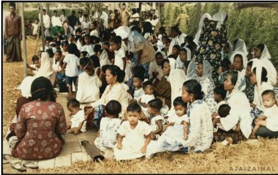
"Maulud Nabi Di Bangi 1957" ( Kiri: Gambar asal. Kanan: Gambar diperbaiki).