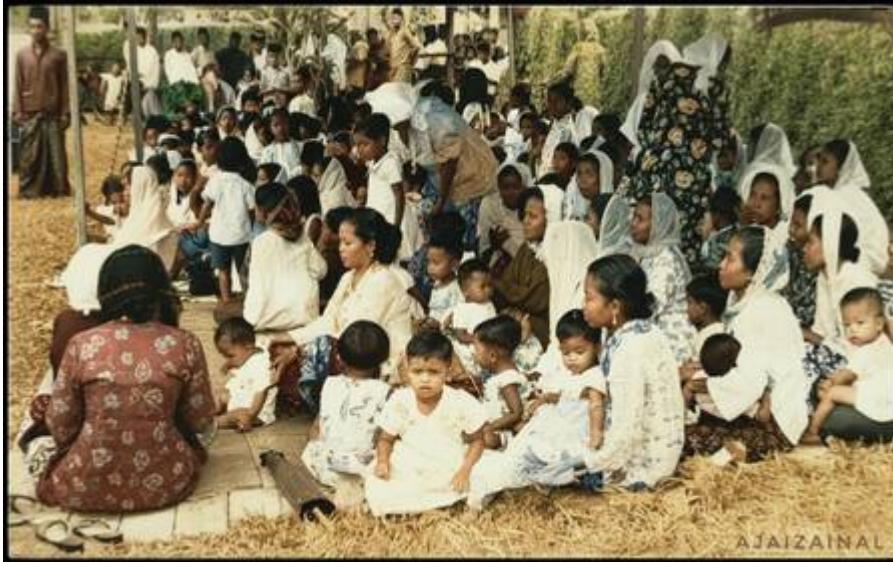
"Maulud Nabi Di Bangi 1957" ( Kiri: Gambar asal. Kanan: Gambar diperbaiki).