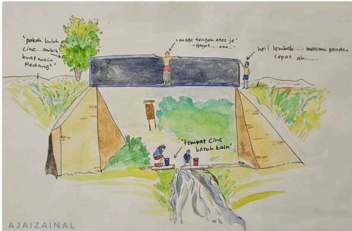
"Jambatan Hitam Sungai Bangi"

"Masa kecil - kecil dulu kitaorang akan buat ujian keberanian menyeberang jambatan dari sisi jambatan keretapi ni dan jugak kena terjun ke bawah untuk buktikan kita ni bukan pondan. Kalau dulu - dulu dipanggil pondan memang malu betul...jadi memang semua sanggup terjun ke sungai walaupun banyak batu asalkan tak menanggung sakit hati dan malu dipanggil pondan. ilustrasi kartun - ajaizainal 1998"