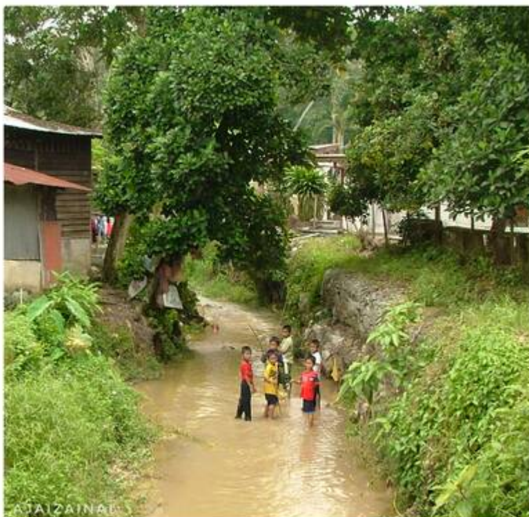
"Foto Tahun 2003, lokasi belakang rumah Pak Long Musa, berdekatan rumah Cik Iti dan Masjid"