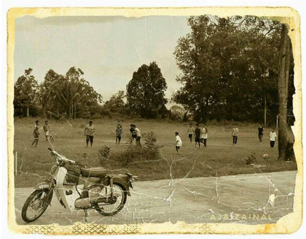
"Padang Bola Kampung Bahagia Bangi" (Faizal Zainal @ Facebook Pekan Bangi, 18 Oktober 2025: "Padang Bola Kampung Bahagia Bangi").