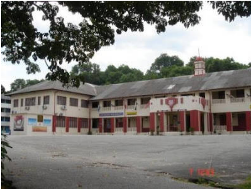
Kiri: "THE SCHOOL 7-7-1977"