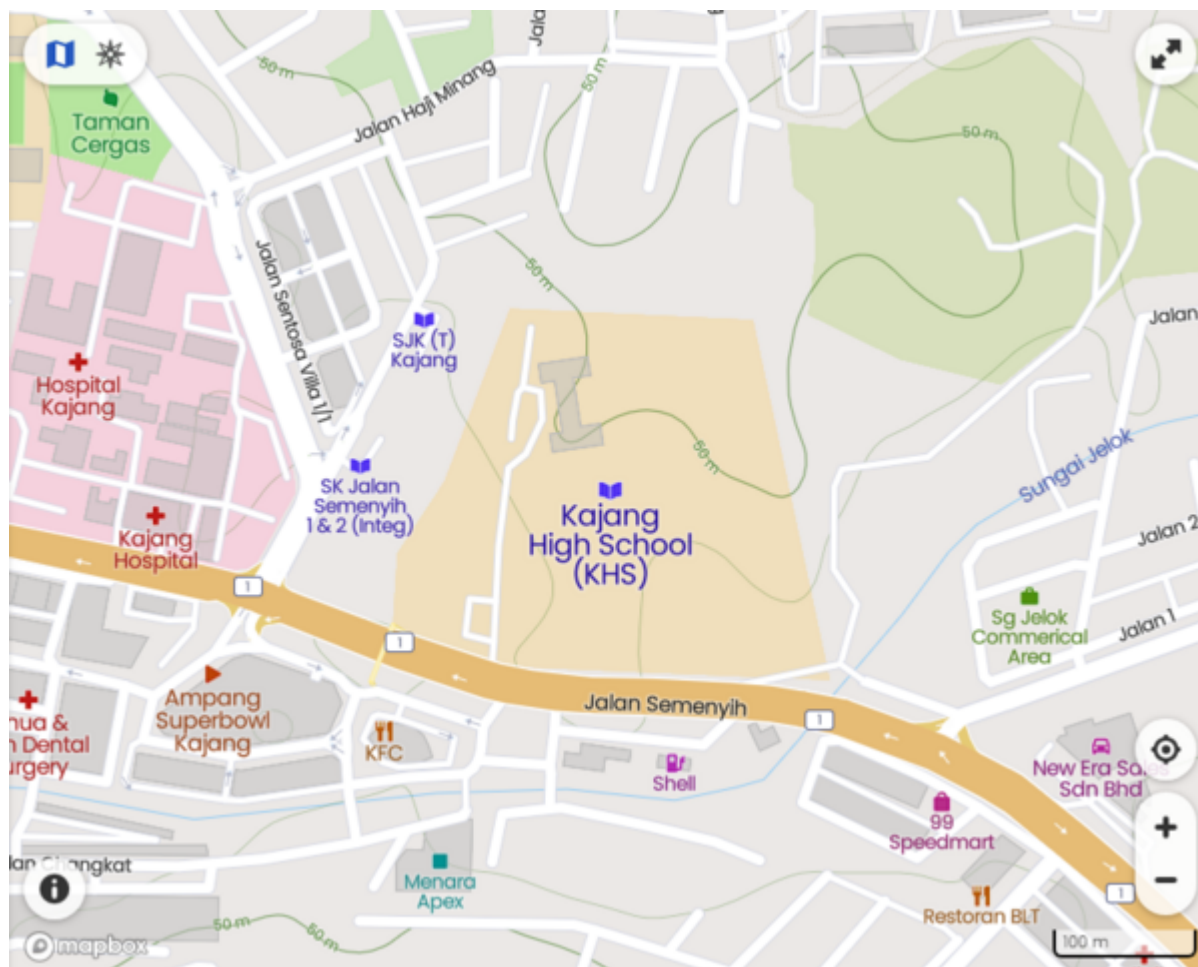
Lokasi Kajang High School kini

"HORAS ! SEPUTAR DAN BERPUTAR-PUTAR DI JALAN RAJA ALANG,KAJANG,SEL").