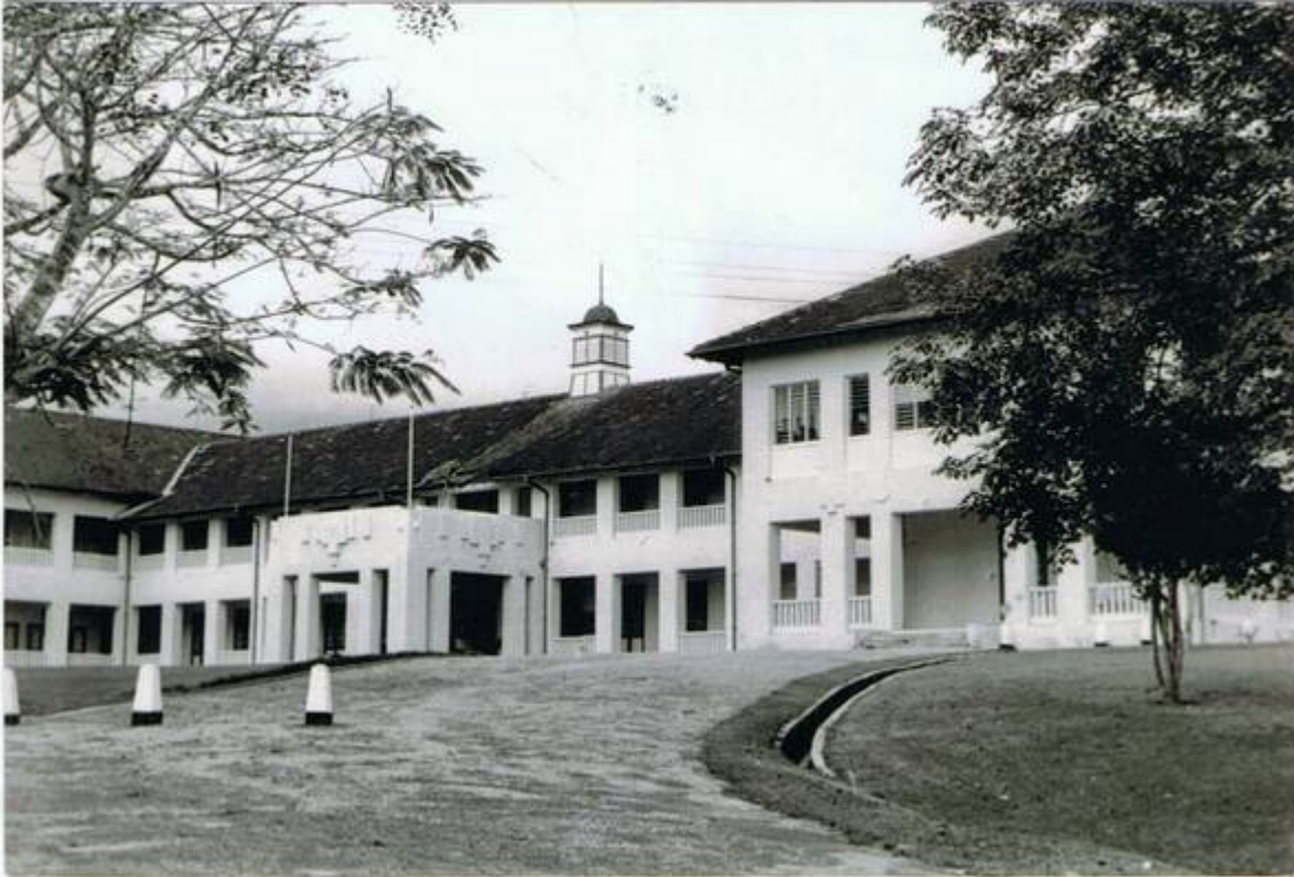
"Kajang High School, C.1956"