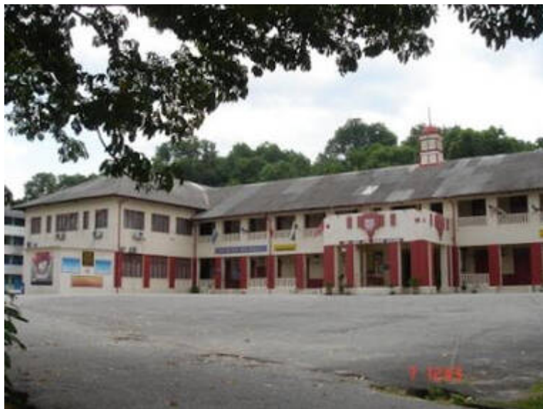
Kiri: "THE SCHOOL 7-7-1977"