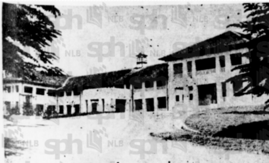
The High School, Kajang, which is the only Government English School, to be seen on the top of a hill out of Kajang Town.

"Some Old Forgotten Things About Kajang High School: CHAPTER 2: THE KAJANG HIGH SCHOOL (1930 - 1945)".