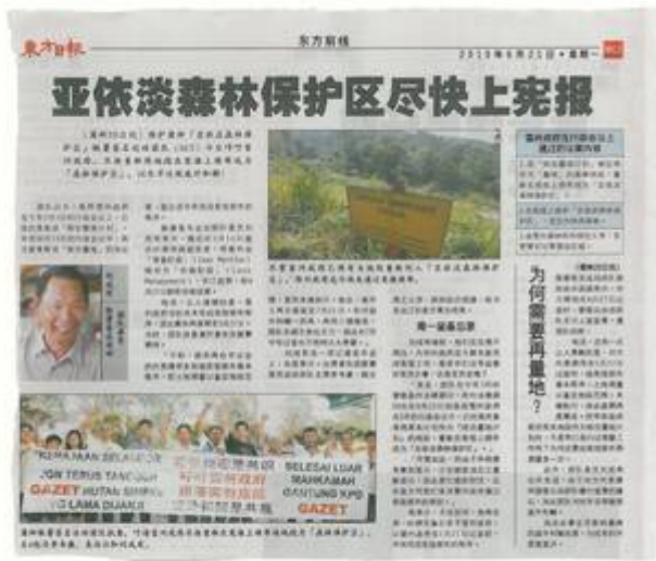
Kiri: The Star, 21 Jun 2010

(Sumber: Signature Campaign Teamwork (SCT) Saujana Puchong, 22 Jun 2010: