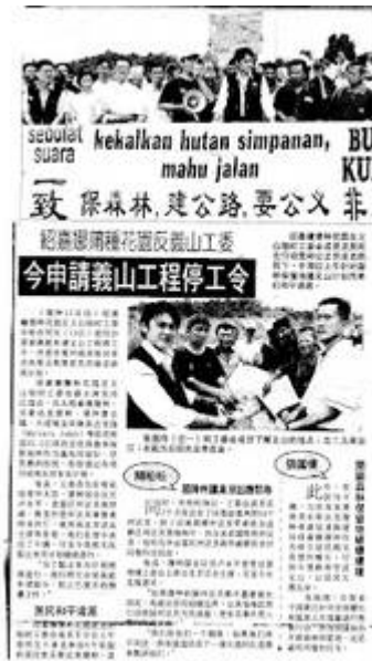
"Newspaper cutting on the event"