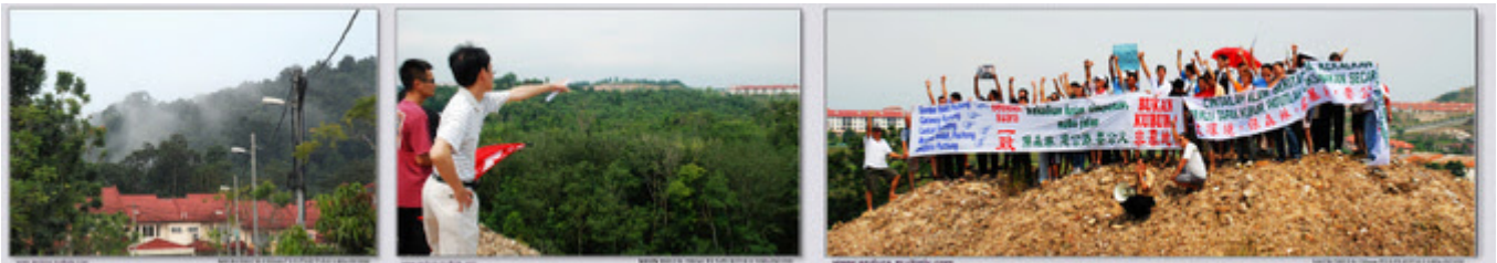
Gambar-gambar sekitar lokasi protes

"Protes SCT-Saujana Puchong "Kekalkan hutan simpanan, mahu Jalan BUKAN KUBUR" di Lestari Puchong").