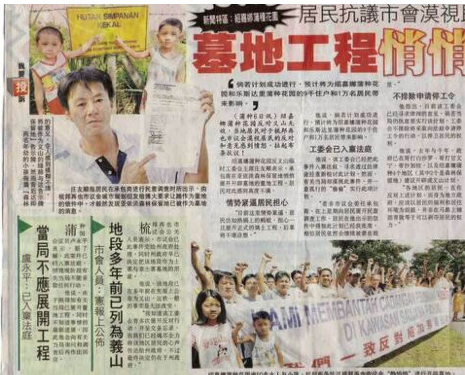
Kiri: The Star, 8 May 2007 (Signature Campaign Teamwork (SCT) Saujana Puchong, 10 Mei 2007:

"re: Newspaper Cuttings of protest on May 6, 2007").