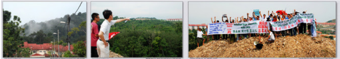
Gambar-gambar sekitar lokasi protes

"Protes SCT-Saujana Puchong "Kekalkan hutan simpanan, mahu Jalan BUKAN KUBUR" di Lestari Puchong").