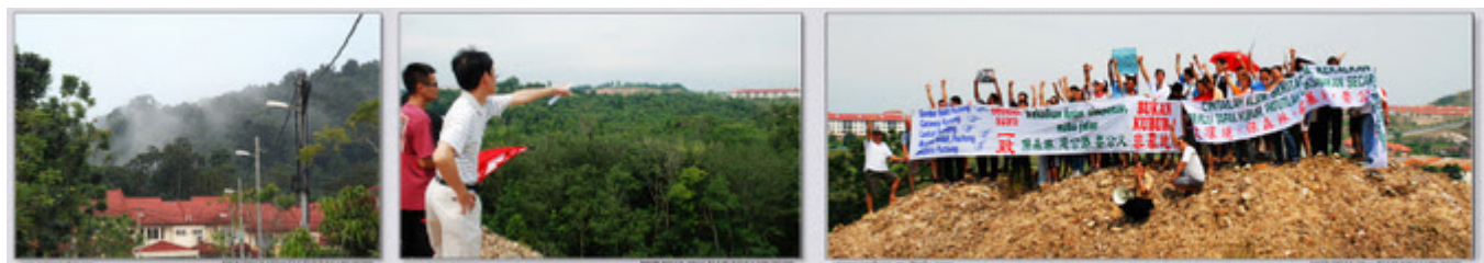
Gambar-gambar sekitar lokasi protes

"Protes SCT-Saujana Puchong "Kekalkan hutan simpanan, mahu Jalan BUKAN KUBUR" di Lestari Puchong").