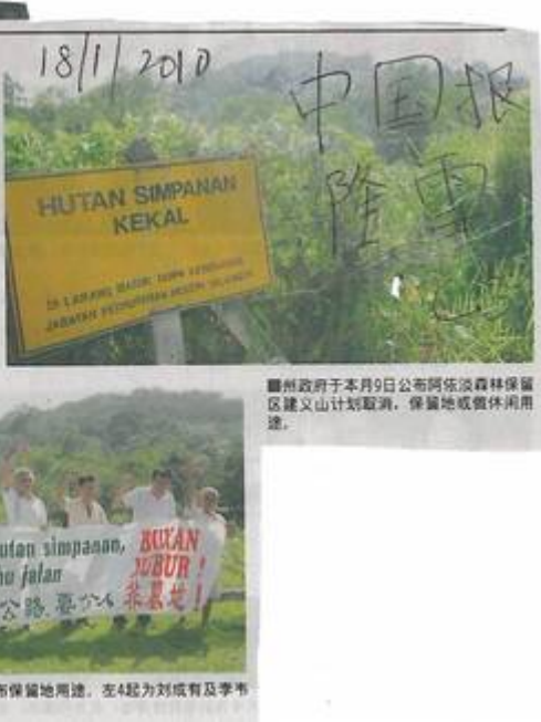
Kiri: Sinar Harian, 18 Januari 2010