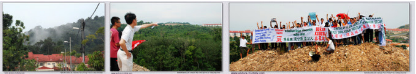
Gambar-gambar sekitar lokasi protes

"Protes SCT-Saujana Puchong "Kekalkan hutan simpanan, mahu Jalan BUKAN KUBUR" di Lestari Puchong".