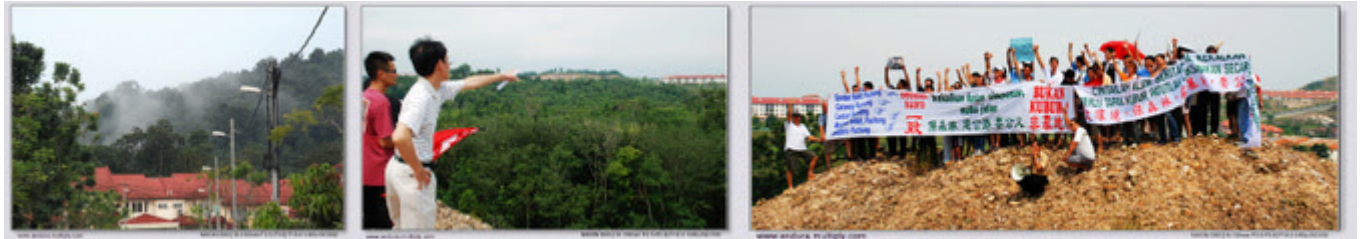
Gambar-gambar sekitar lokasi protes

"Protes SCT-Saujana Puchong "Kekalkan hutan simpanan, mahu Jalan BUKAN KUBUR" di Lestari Puchong").