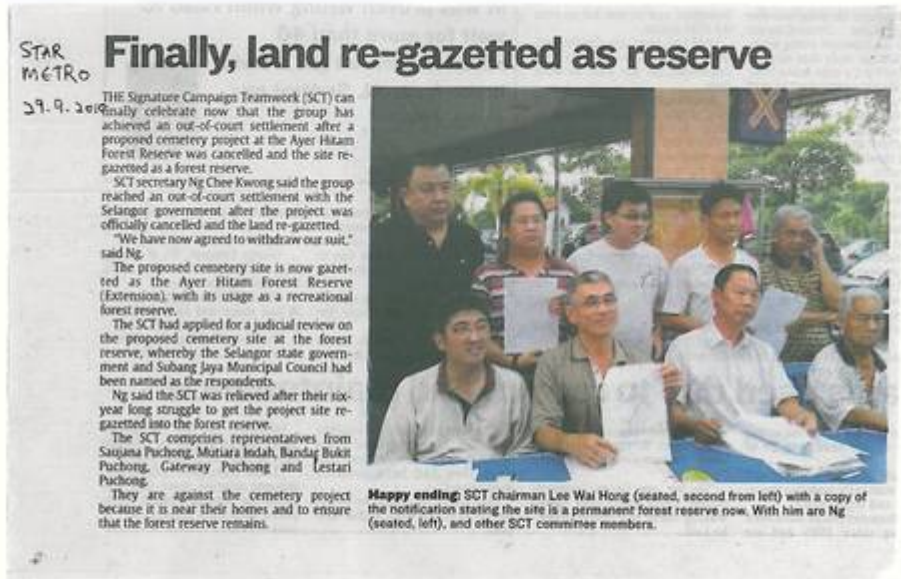
The Star, 29 September 2010 (Signature Campaign Teamwork (SCT) Saujana Puchong, 30 September 2010:

"News Report on 26 Sept 2010 Press Conference").