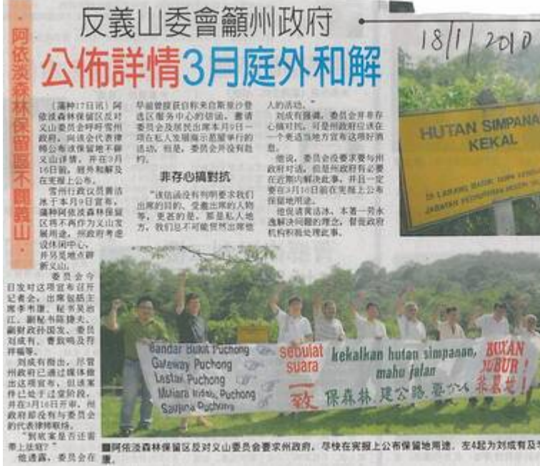
Kiri: Sinar Harian, 18 Januari 2010