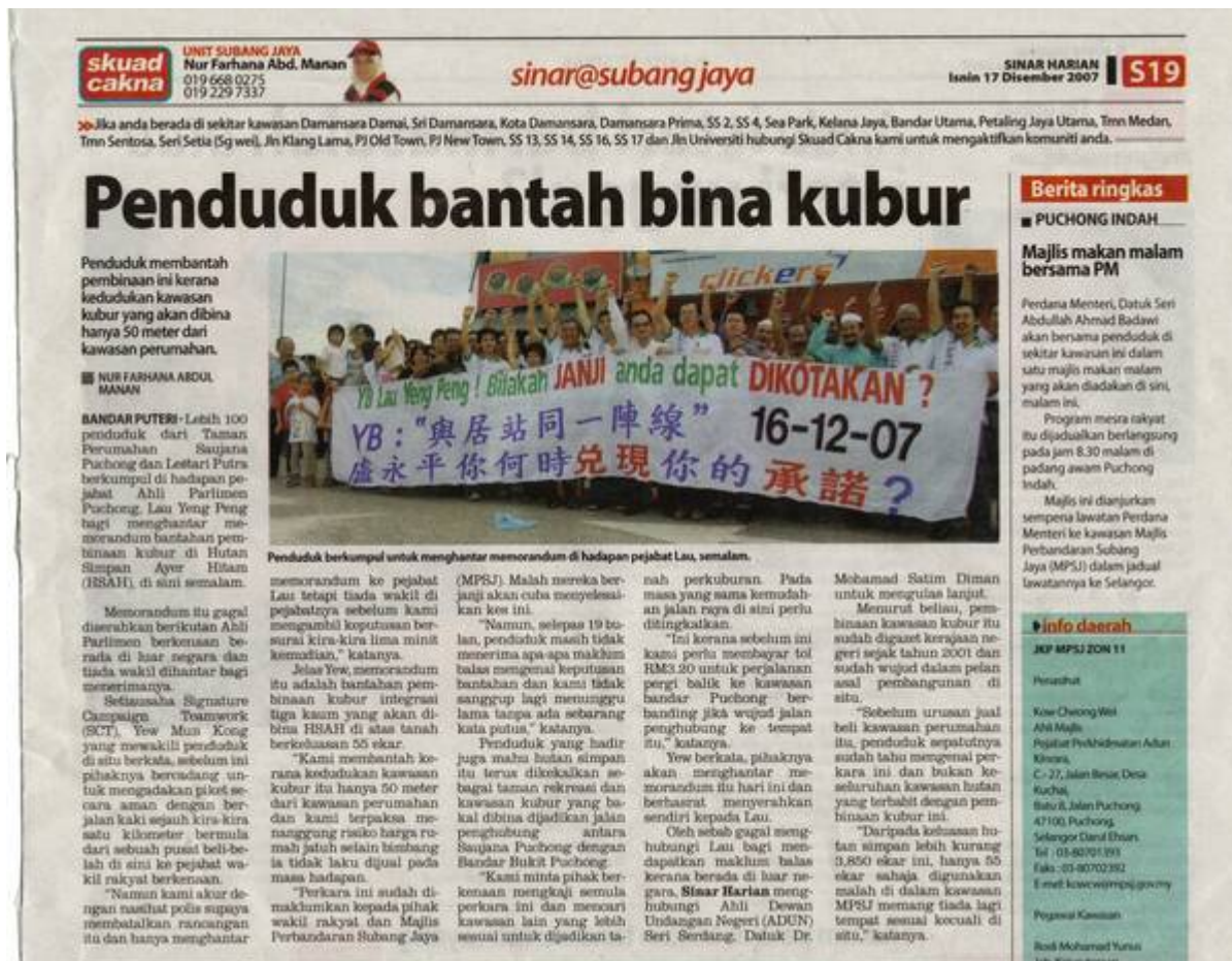
"Penyerahan Memorandum kepada Ahli Parlimen Puchong" (Signature Campaign Teamwork (SCT) Saujana Puchong, 30 Disember 2007: