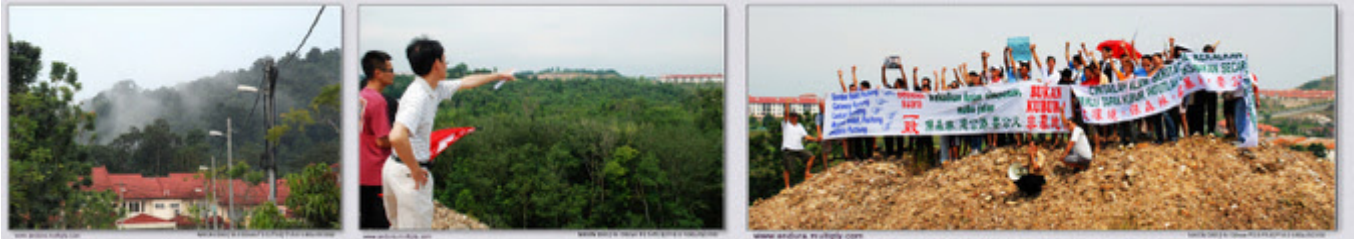
Gambar-gambar sekitar lokasi protes