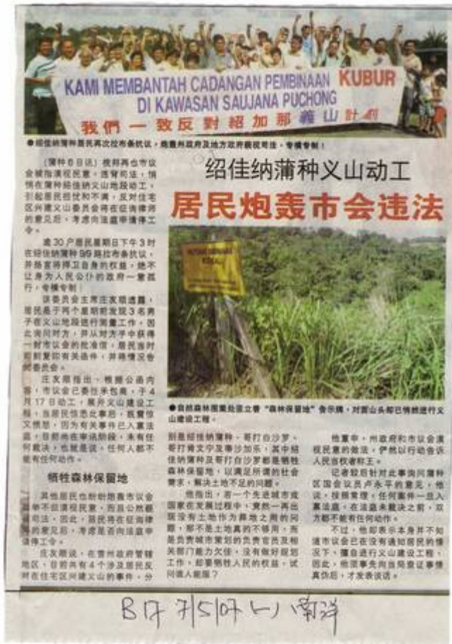
(The Star, 8 May 2007:

"re: Newspaper Cuttings of protest on May 6, 2007").