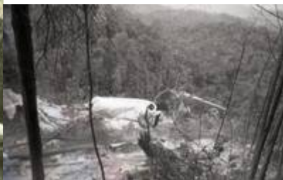
“Copyright to Jabatan Penerangan Malaysia.” (Ashmil Abd Ghani @ MalaysianWings, April 29, 2013:

| "Flying Tiger Line Flight 66 Crashed in Puchong on 19 February 1989").