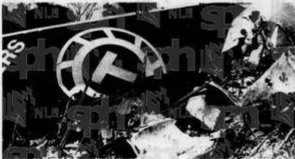
TINGGAL BANGKAI: Para pekerja penyelamat dan polis berusaha mencari mayat di bawah kecaian bangkai jet Boeing 747 itu semalam. Salah satu bahagian enjinnya tercampak kira-kira 150 kilometer dari tempat kemalangan.

Pengarah lalu lintas udara Jabatan Penerbangan Awam, Encik Nordin Haji Saad, memberitahu sidang akhbar di sini semalam bahawa pesawat tersebut berlepas dari Singapura pada 6.05 pagi membawa kargo biasa apabila ia terputus hubungan dengan menara kawalan.