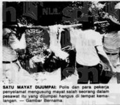
SATU MAYAT DIJUMPAI: Polis dan para pekerja penyelamat mengusung mayat salah seorang dalam pesawat itu yang dijumpai hangus di tempat kemalangan. — Gambar Bernama.

Ia mengendalikan sekurang-kurangnya tiga penerbangan seminggu ke Kuala Lumpur. — Bernama.