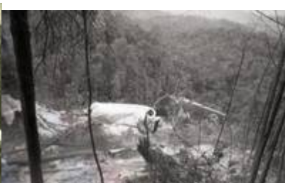
“Copyright to Jabatan Penerangan Malaysia.” (Ashmil Abd Ghani @ MalaysianWings, April 29, 2013:

| "Flying Tiger Line Flight 66 Crashed in Puchong on 19 February 1989").