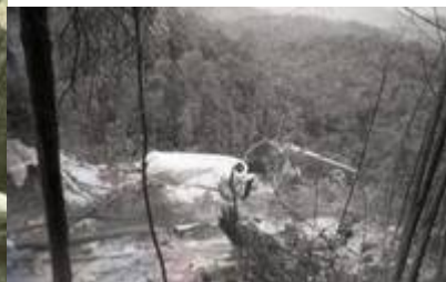
“Copyright to Jabatan Penerangan Malaysia.” (Ashmil Abd Ghani @ MalaysianWings, April 29, 2013:

| "Flying Tiger Line Flight 66 Crashed in Puchong on 19 February 1989").