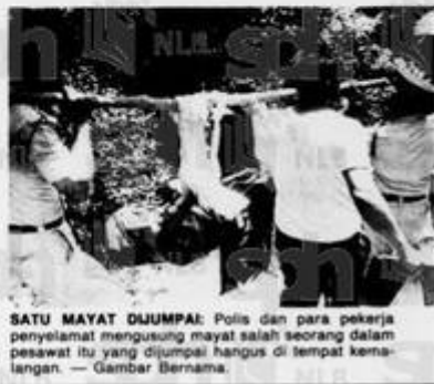
SATU MAYAT DIJUMPAI: Polis dan para pekerja penyelamat mengusung mayat salah seorang dalam pesawat itu yang dijumpai hangus di tempat kemalangan. — Gambar Bernama.

Ia mengendalikan sekurang-kurangnya tiga penerbangan seminggu ke Kuala Lumpur. — Bernama.