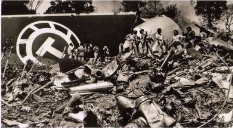
Police and workers sift through the wreckage of the cargo plane which crashed into a hillside.

The crash occurred in fog at 6.36am just before the Boeing 747-200 was due to land at the Kuala Lumpur International Airport in Subang with a cargo of textiles. The explosion rocked about 50 houses nearby.