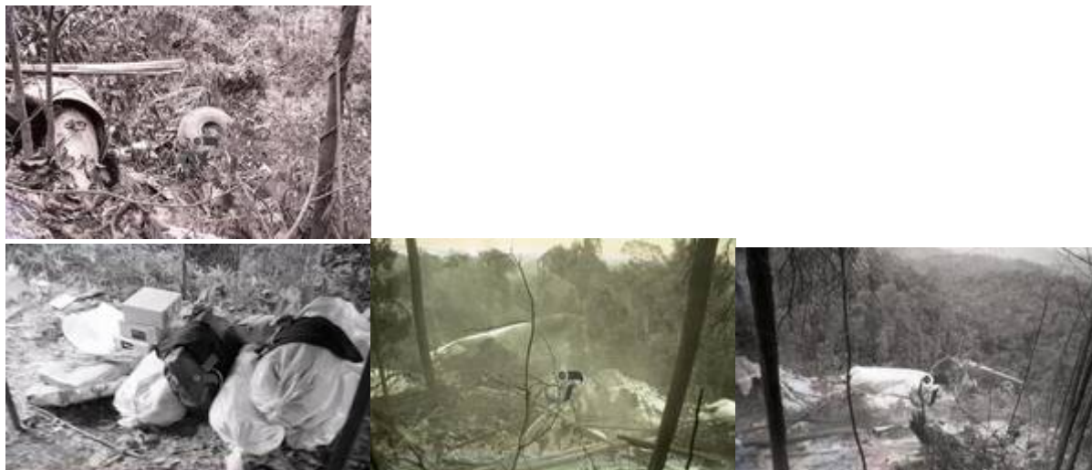
“Copyright to Jabatan Penerangan Malaysia.” (Ashmil Abd Ghani @ MalaysianWings, April 29, 2013:

| "Flying Tiger Line Flight 66 Crashed in Puchong on 19 February 1989").