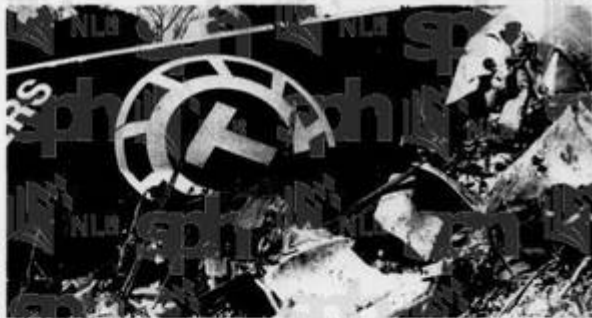
TINGGAL BANGKAI: Para pekerja penyelamat dan polis berusaha mencari mayat di bawah kecaian bangkai jet Boeing 747 itu semalam. Salah satu bahagian enjinnya tercampak kira-kira 150 kilometer dari tempat kemalangan.

Pengarah lalu lintas udara Jabatan Penerbangan Awam, Encik Nordin Haji Saad, memberitahu sidang akhbar di sini semalam bahawa pesawat tersebut berlepas dari Singapura pada 6.05 pagi membawa kargo biasa apabila ia terputus hubungan dengan menara kawalan