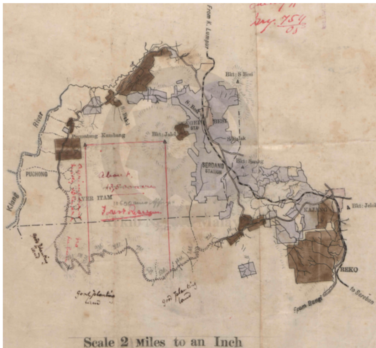
Cadangan Awal Hutan Ayer Itam (21 Julai 1905).

road to Cheras and 1st to 5th mile Ayer Itam road both sides. Also for 2 miles on every side of the reserve. It is just in such places we want to Reserve for the benefit of the miners as where all other sources fail we would open the Reserve to the woodcutters in yearly coupes. If this had been done when I suggested it around K L in 1897 we should not now have to pay such a price for our firewood. ? my report to the Resident about that year."