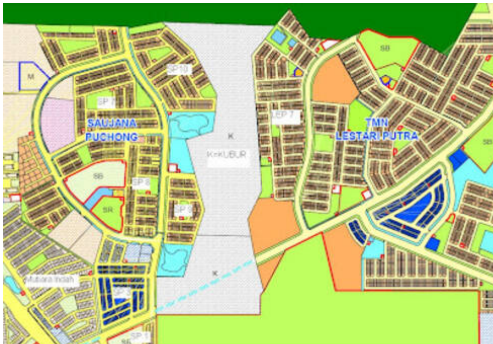
Peta lokasi tapak cadangan perkuburan (Signature Campaign Teamwork (SCT) Saujana Puchong, 31 Disember 2007:

"Program SCT membantah Rancangan MPSJ MEMPERBESARKAN tanah perkuburan di Hutan Simpanan Ayer Hitam").