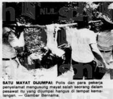
SATU MAYAT DIJUMPAI: Polis dan para pekerja penyelamat mengusung mayat salah seorang dalam pesawat itu yang dijumpai hangus di tempat kemalangan. — Gambar Bernama.

Ia mengendalikan sekurang-kurangnya tiga penerbangan seminggu ke Kuala Lumpur. — Bernama.