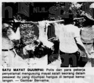
SATU MAYAT DIJUMPAI: Polis dan para pekerja penyelamat mengusung mayat salah seorang dalam pesawat itu yang dijumpai hangus di tempat kemalangan. — Gambar Bernama.

Ia mengendalikan sekurang-kurangnya tiga penerbangan seminggu ke Kuala Lumpur. — Bernama.