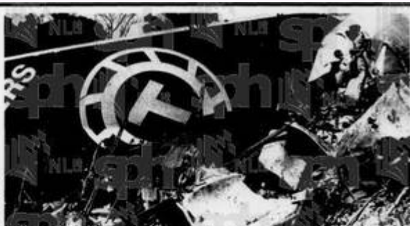
TINGGAL BANGKAI: Para pekerja penyelamat dan polis berusaha mencari mayat di bawah kecaian bangkai jet Boeing 747 itu semalam. Salah satu bahagian enjinnya tercampak kira-kira 150 kilometer dari tempat kemalangan.