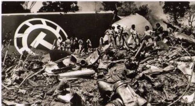
Police and workers sift through the wreckage of the cargo plane which crashed into a hillside.

The crash occurred in fog at 6.36am just before the Boeing 747-200 was due to land at the Kuala Lumpur International Airport in Subang with a cargo of textiles. The explosion rocked about 50 houses nearby.