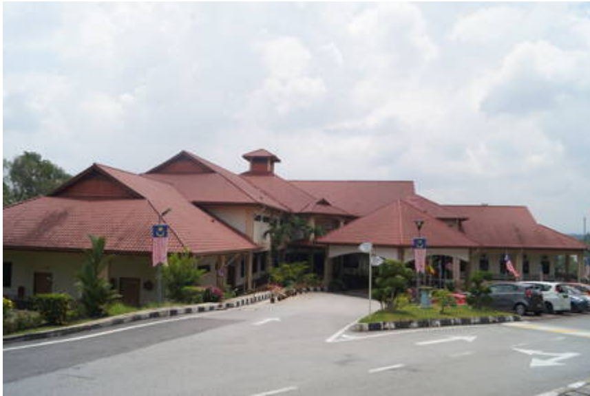
Bangunan utama EiMAS

Kiri: Ketika perasmian, tahun 2002 (Enviro Knowledge Management Center (Enviro-Museum), 2015: