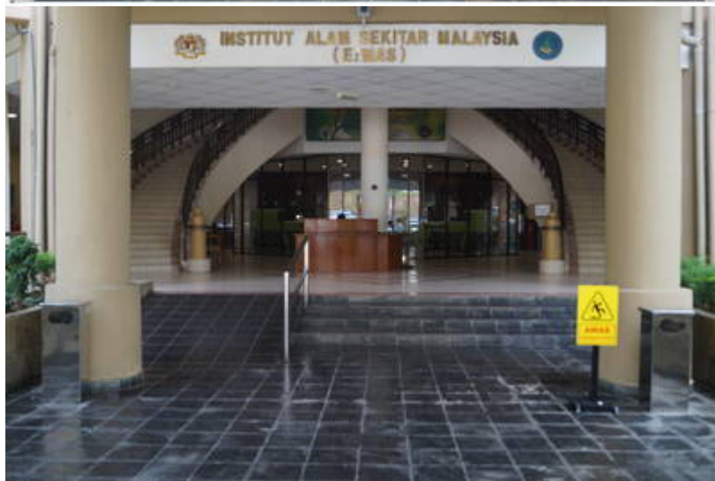
Pintu masuk EiMAS

Kiri: Ketika perasmian, tahun 2002 (Enviro Knowledge Management Center (Enviro-Museum), 2015: