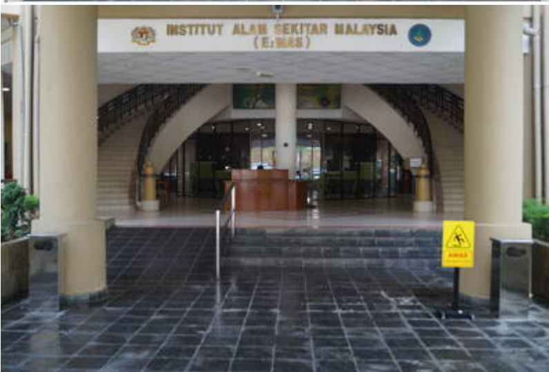
Pintu masuk EiMAS

Kiri: Ketika perasmian, tahun 2002 (Enviro Knowledge Management Center (Enviro-Museum), 2015: