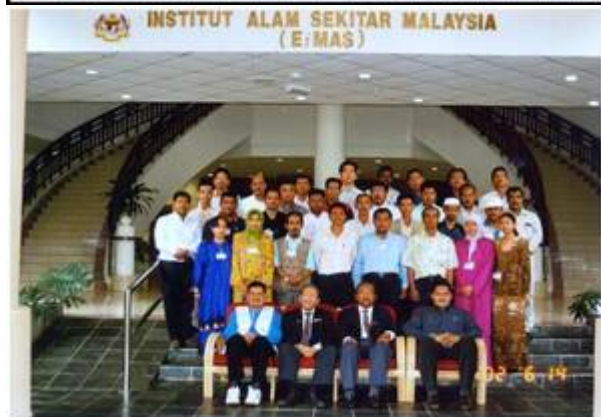
Kiri: “Kursus di bangunan IKLAS sebelum bangunan ditukar nama kepada EiMAS.”