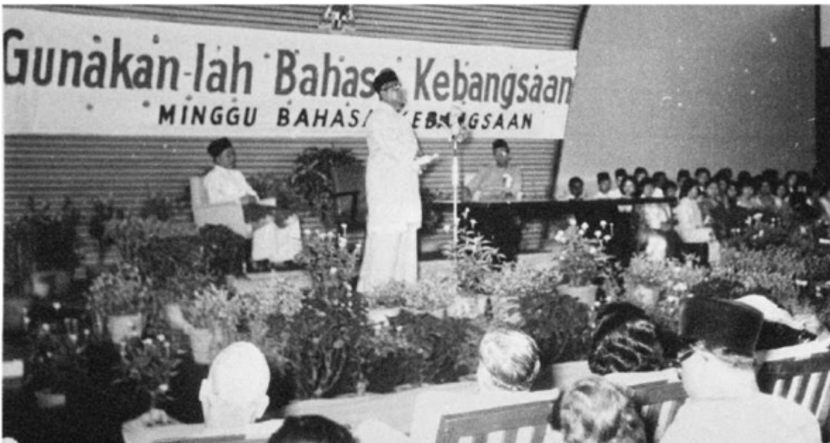
TUNKU Abdul Rahman Putra Al-Haj melancarkan Minggu Bahasa kebangsaan pada 1960.