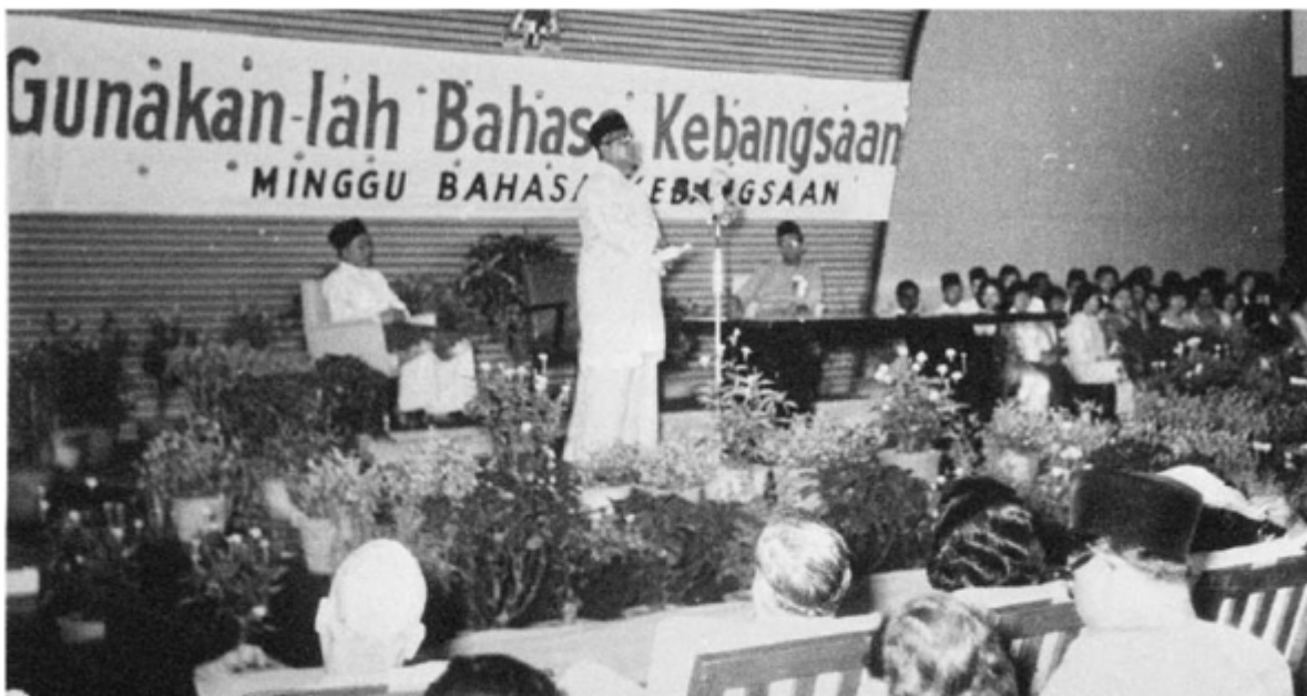
TUNKU Abdul Rahman Putra Al-Haj melancarkan Minggu Bahasa kebangsaan pada 1960.