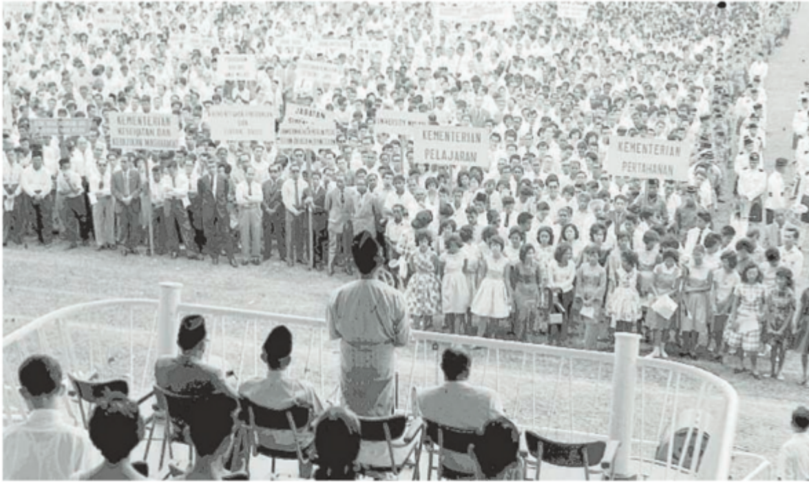
MAJLS pelancaran Bulan Bahasa Kebangsaan pada 1961.