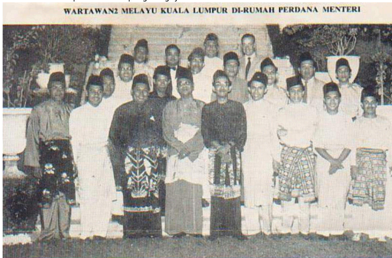
WARTAWAN2 MELAYU KUALA LUMPUR DI-RUMAH PERDANA MENTERI

Straits Times Press Limited , satu-satunya akhbar yang menggunakan tulisan rumi ketika itu (Akhbar Utusan Melayu ditubuhkan tahun 1939) masih dalam tulisan jawi). Sumber beritanya adalah terjemahan terus dari Straits Times, atau dihantar oleh pemberita sendiri di bandar-bandar besar melalui mesin teleprinter. Ketua pengarangnya ialah A. Samad Ismail .