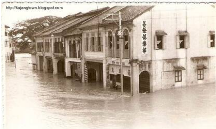
Kiri (8) Gambar diambil dari atas jambatan keretapi. Kelihatan “River View Garden”, bertentangan tokong “Sea Yea (Sin Sze Si Ya)”, di belakang Jalan Mendaling.