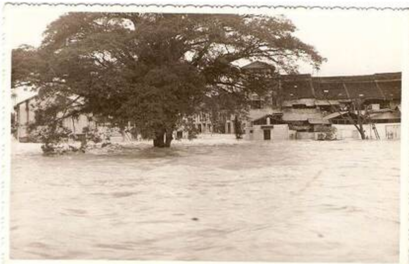
Kanan (9) Jalan Mendaling - Tokong “Sea Yea (Sin Sze Si Ya)” dari jarak dekat (kedai paling hujung di sebelah kiri).