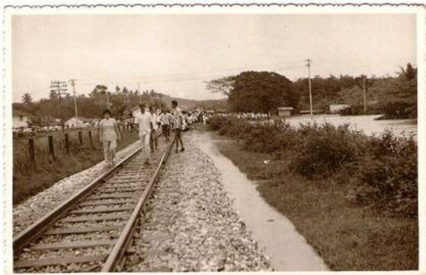
(6): Landasan keretapi di antara Sungai Chua dan jambatan keretapi.