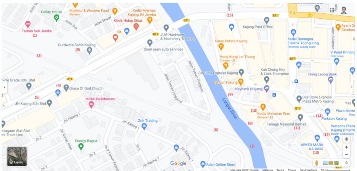
Peta kawasan banjir Kajang 1971.

Peta dan gambar-gambar kawasan banjir di sepanjang tebing Sungai Langat di Kajang (termasuk Kampung Jambu dan Sungai Chua), yang dirakamkan pada tahun 1971:-