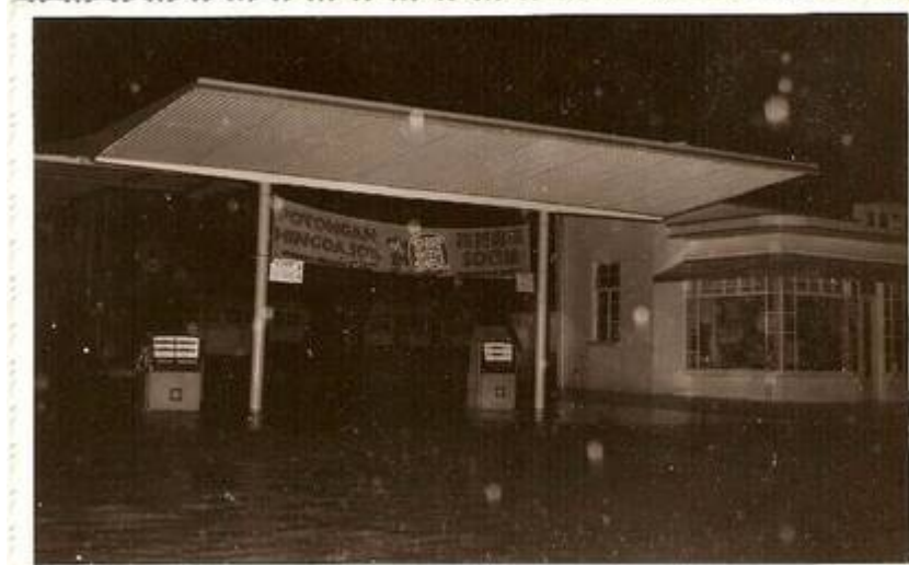
Kiri (13): Pasar lama Kajang (kini Arked Mara).

Kanan (14): Stesen minyak Shell, berhadapan Stesen Bas Foh Hup (kini tidak lagi beroperasi, tapaknya sebahagian daripada Plaza Metro). Stesen minyak ini telah berpindah ke hadapan Kajang