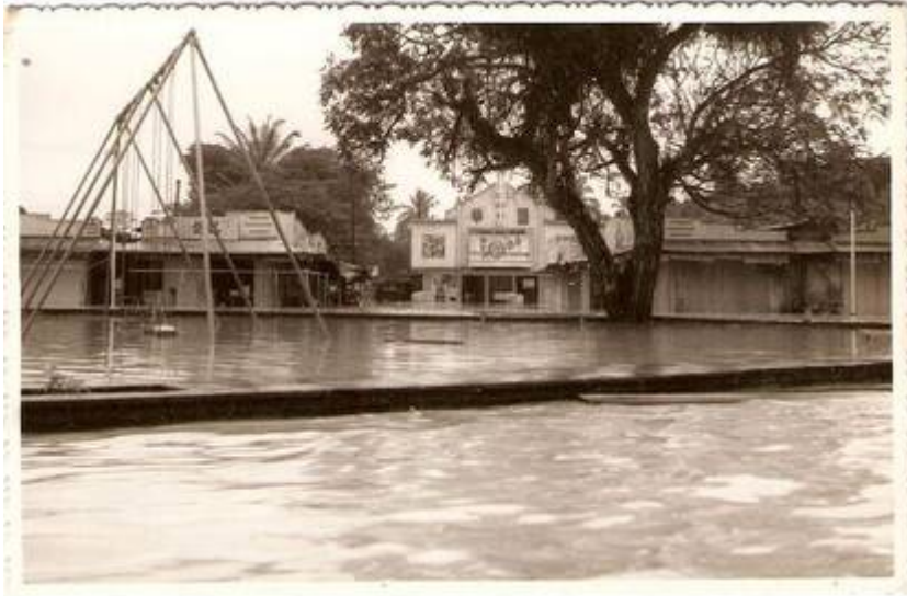
(12) Bulatan Kajang:-

Kiri: Stesen minyak Shell di tengah. Bazaar di sebelah kanan (kini bangunan Metro Plaza).