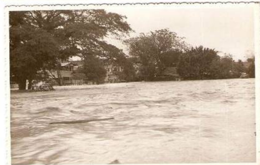
(10) Pandangan sisi tokong “Sea Yea (Sin Sze Si Ya)”. Bahagian yang dinaiki air kini tokong Hokkien.