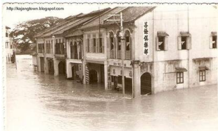
Kiri (8) Gambar diambil dari atas jambatan keretapi. Kelihatan “River View Garden”, bertentangan tokong “Sea Yea (Sin Sze Si Ya)”, di belakang Jalan Mendaling.