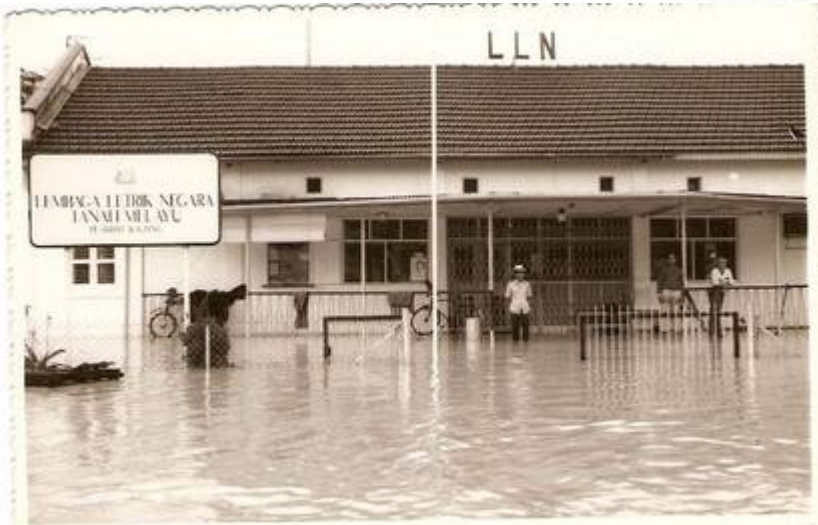
(11) LLN Kajang (kini Kedai Tenaga TNB Kajang), bersebelahan Arked Mara.