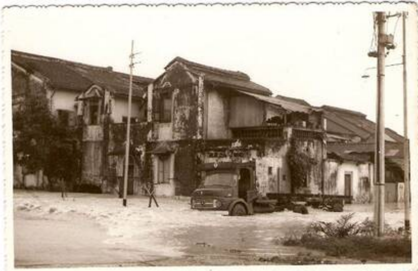
(15): Pandangan sisi bengkel Sin Swee Kee. Di sebelah kanannya pejabat MCA (sedang dibina).