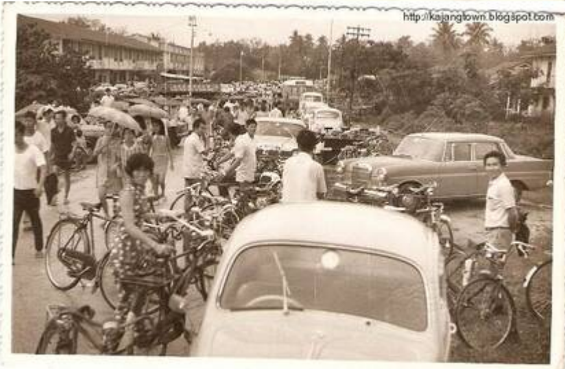
Kiri (4): Sekitar Pejabat Pendaftaran lama.