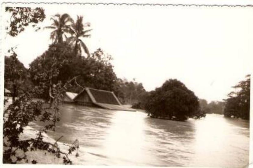
(1) Kampung Jambu: Kedudukannya di tebing Sungai Langat, menyebabkan ianya kawasan pertama yang ditenggelami banjir.