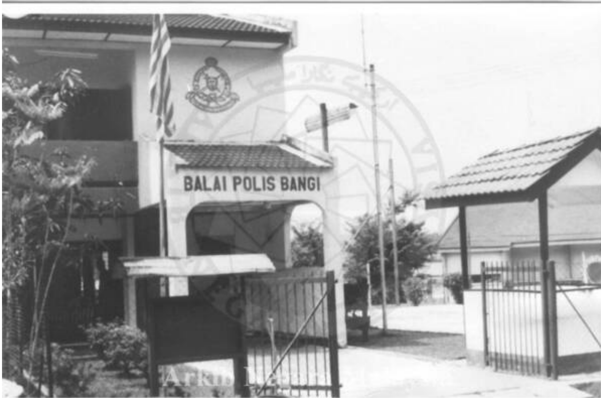
Balai Polis Bangi 1980-1990an, di No. 46 Lorong Bunga Melor 2, Taman Angsana

"BALAI POLIS BANGI. TARIKH BALAI - IBU PEJABAT POLIS DAERAH KAJANG, NEGERI SELANGOR").