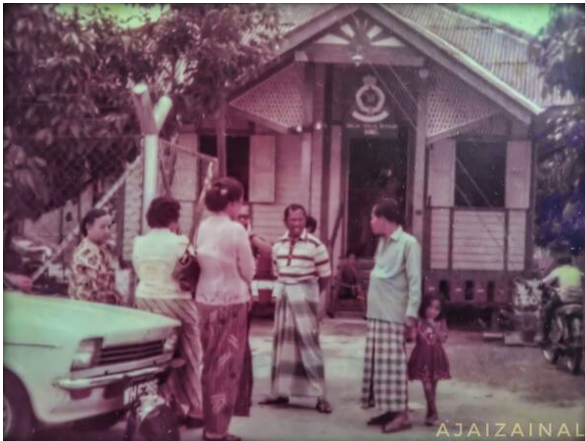
“Wajah Balai Polis Bangi - sekitar tahun 70an. Dibina pada tahun 1914 dan siap sekitar penghujung 1915 dengan kos sekitar $7,000 untuk membina balai dan barrack Polis. Balai Polis ini terletak berdekatan Stesen Keretapi Bangi (1902), Masjid Kariah Bangi (1924) dan Pekan Bangi, di sisi jalan Bangi - Semenyih dan di belakangnya mengalir Sungai Bangi yang jernih..” (Faizal Hj Zainal @ Selangor 10, 16 Ogos 2020:

Sejarah Tempatan: Wajah Balai Polis Bangi - sekitar tahun 70an).