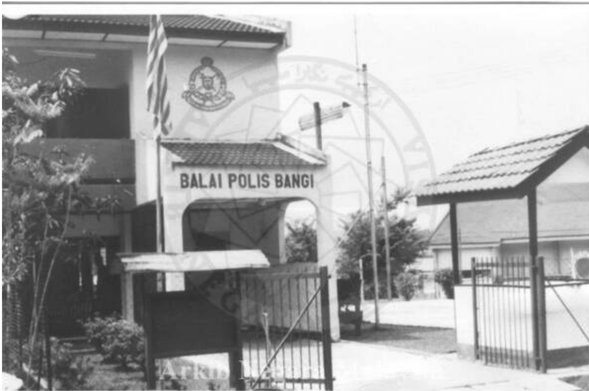
Balai Polis Bangi 1980-1990an, di No. 46 Lorong Bunga Melor 2, Taman Angsana (POLIS DIRAJA MALAYSIA (PDRM), 1980-1990an

"BALAI POLIS BANGI. TARIKH BALAI - IBU PEJABAT POLIS DAERAH KAJANG, NEGERI SELANGOR").