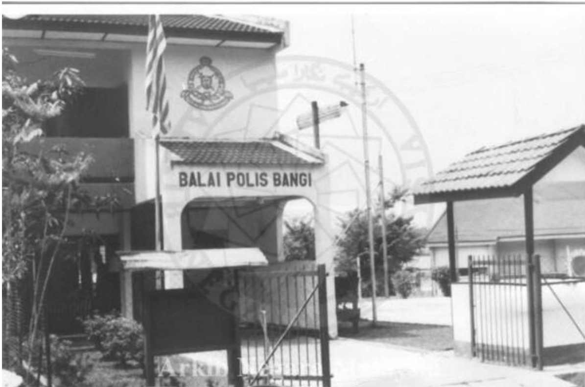
Balai Polis Bangi 1980-1990an, di No. 46 Lorong Bunga Melor 2, Taman Angsana (POLIS DIRAJA MALAYSIA (PDRM), 1980-1990an

"BALAI POLIS BANGI. TARIKH BALAI - IBU PEJABAT POLIS DAERAH KAJANG, NEGERI SELANGOR").