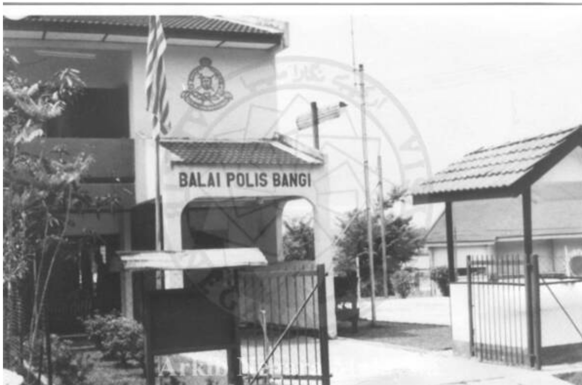
Balai Polis Bangi 1980-1990an, di No. 46 Lorong Bunga Melor 2, Taman Angsana (POLIS DIRAJA MALAYSIA (PDRM), 1980-1990an

"BALAI POLIS BANGI. TARIKH BALAI - IBU PEJABAT POLIS DAERAH KAJANG, NEGERI SELANGOR").