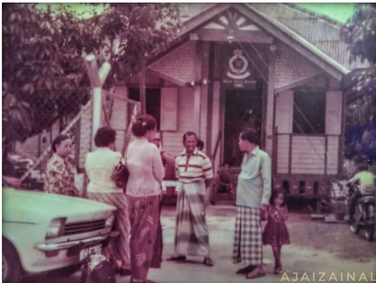
"Wajah Balai Polis Bangi - sekitar tahun 70an. Dibina pada tahun 1914 dan siap sekitar penghujung