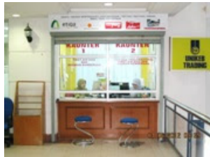
1. Unit Perkhidmatan Pelanggan dan Pelancongan (U3P) - insuran kenderaan, tiket kapal terbang, tiket bas, pelancongan dalam dan luar negara, umrah, penghantaran dokumen