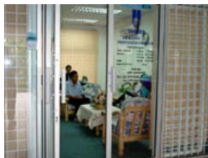
3. Unit Ar-Rahnu - skim pajak gadai islam