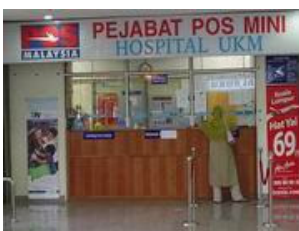
+ Pejabat Pos Mini