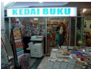
+ Kedai Buku