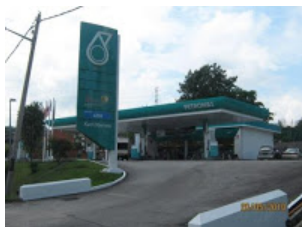
1. Stesyen Minyak Petronas + UNIKEB 1 di Seksyen 1, Bandar Baru Bangi