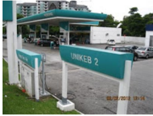
+ UNIKEB 2 di Seksyen 4, Bandar Baru Bangi