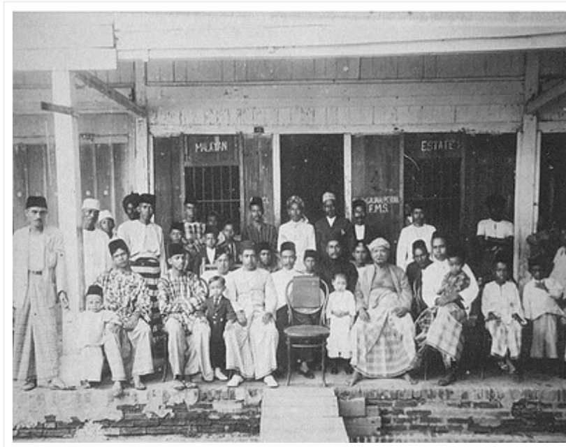
The Mandailings in Perak.