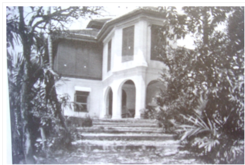
The Rumah Besar, c. 1900-1910.