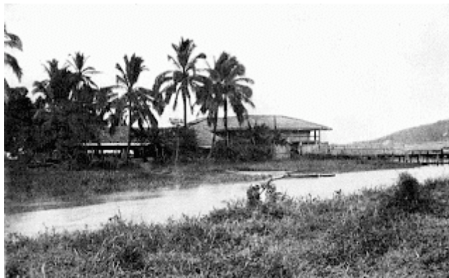
Halt Bungalow (gambar hiasan)

Jadi, banglo singgahan di Telok ini terletak sebelas batu dari Klang, bererti di Batu 11 Kampung Telok, mungkin sekali di kawasan Simpang Kg. Bandar (Segenting) yang terletak di tebing sebelah utara Sungai Langat, yang berhadapan dengan Kg. Bandar di Jugra di tebing sebelah selatan sungai tersebut.