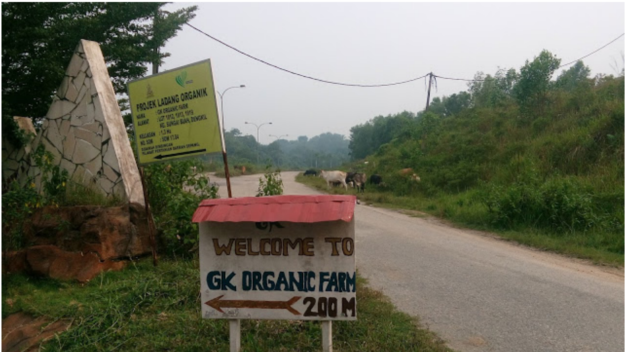
~Ladang Kambing & Lembu~

[ http://1.bp.blogspot.com/-vXGXxCXg8Pc/ViytXLoiyXI/AAAAAAAAAEE/H-GJjeRp3XQ/s1600/farm.jpg ]