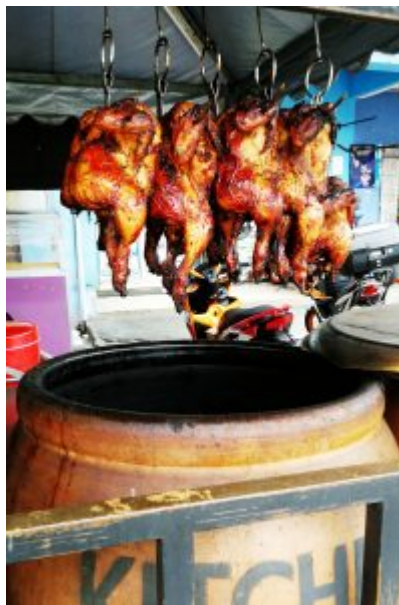
Ayam Tempayan yang digunakan untuk Nasi Ayam

Jika ditanya kepada GMB, antara masakan pilihan pada waktu itu adalah Nasi Ayam Tempayan dan Pajeri Nanas menjadi kegemaran. Manakala di sebelah malam masakan Tom Yam dan Nasi Goreng yang berharga RM2.50 adalah trade-mark Gerai Azura pada suatu ketika di awal tahun 2000 an dahulu.