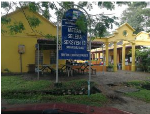
Medan Selera Seksyen 13 Bandar Baru Bangi