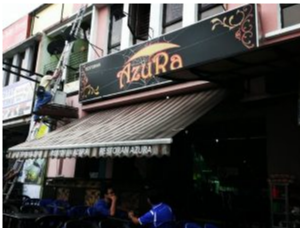
Restoran Azura Seksyen 3 Bandar Baru Bangi

Kini BBB telah mempunyai banyak restoran dan pengusaha kedai makanan dan ada sesetengahnya melabelkan BBB sebagai “Syurga Makanan”. Walaupun telah wujud lebih banyak pesaing, Restoran Azura masih mampu bertahan dan masih meneruskan legasinya walau dalam kepayahan situasi wabak yang melanda.