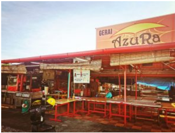
Gerai Azura di Medan Selera Seksyen 16 BBB – Beroperasi sehingga kini.

Berpuluh-puluh gerai Tom Yam dan nasi campur tumbuh bak cendawan tumbuh selepas hujan di kawasan ini dan Gerai Azura menjadi antara pilihan pelajar-pelajar UKM dan pekerja kilang waktu itu kerana terkenal dengan harga yang murah dan masakan yang sedap.