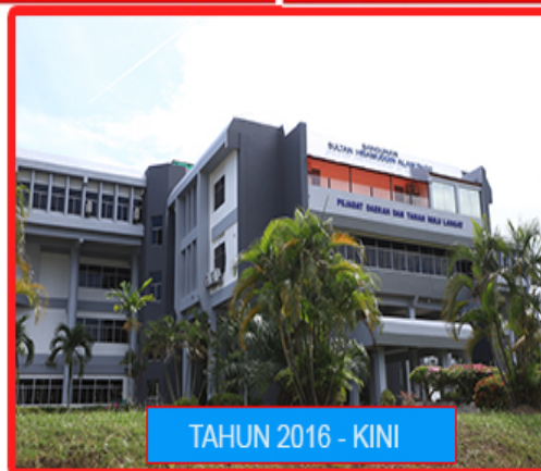
TAHUN 2016 - KINI