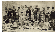
Gambar dan minit mesyuarat Durbar yang pertama

Mesyuarat Durbar merupakan Majlis Raja-raja dan Orang Besar-besar Melayu yang pertama diadakan di mana perkara-perkara mengenai agama, adat-istiadat dan lain-lain perkara yang berkaitan dengan orang Melayu dibincangkan. Terbitan ini mengandungi minit mesyuarat Durbar yang pertama yang berlangsung selama empat hari. Gambar menunjukkan raja-raja dan pembesar Melayu serta pegawai-pegawai British yang hadir. Duduk dari kiri ke kanan : Hugh Clifford (Residen Pahang), J.P.Rodger (Residen Selangor), F.A.Swettenham (Residen Jeneral), Sultan Ahmad (Sultan Pahang), Sultan Abdul Samad (Sultan Selangor), Sir Charles Mitchell (Pesuruhjaya Tinggi), Sultan Idris (Sultan Perak), Tuanku Muhammad (Yang Dipertuan Besar Negeri Sembilan) dan W.H.Treachler (Residen Perak).