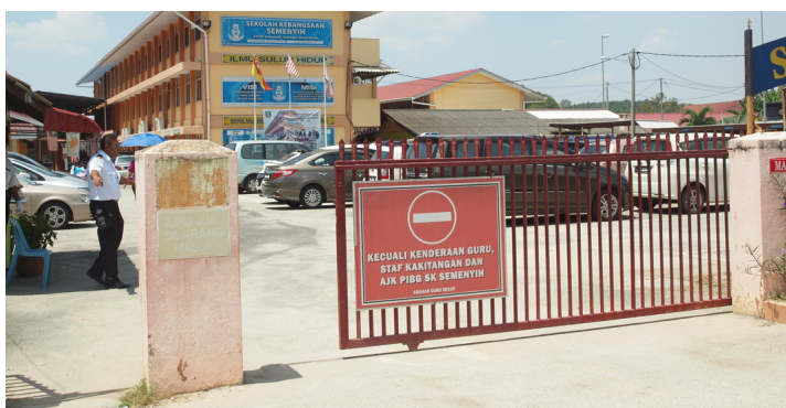
Keadaan Sek. Keb. Semenyih Terkini