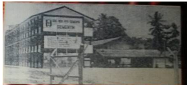
Bangunan Sek. Keb. Semenyih sekitar 1979