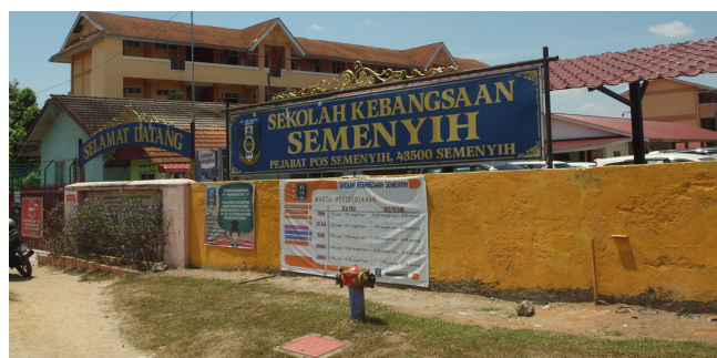
Keadaan Sek. Keb. Semenyih Terkini

HAK CIPTA TERPELIHARA @ UNIT ICT SK SEMENYIH