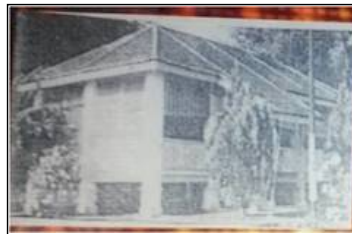
Bangunan Pertama Sek.Keb.Semenyih 1898. Dirobohkan pada 1969

Bangunan asalnya didirikan pada tahun 1898, iaitu satu blok bangunan kayu satu tingkat berlantaikan papan dan beratapkan genting kecil jenis lama. Bangunan ini dirobohkan pada tahun 1969 untuk membina satu blok bangunan dua tingkat pada tahun 1970. Bangunan kedua dibina pada tahun 1935 juga merupakan satu blok bertangga dan berlantaikan papan. Bangunan kedua dirobohkan bagi membina satu blok tiga tingkat pada tahun 1979. Satu blok rumah guru dibina pada tahun 1979 dan pada tahun yang sama sebuah kantin dibina bagi menggantikan kantin lama yang diubahsuai menjadi bilik perdagangan dan stor.