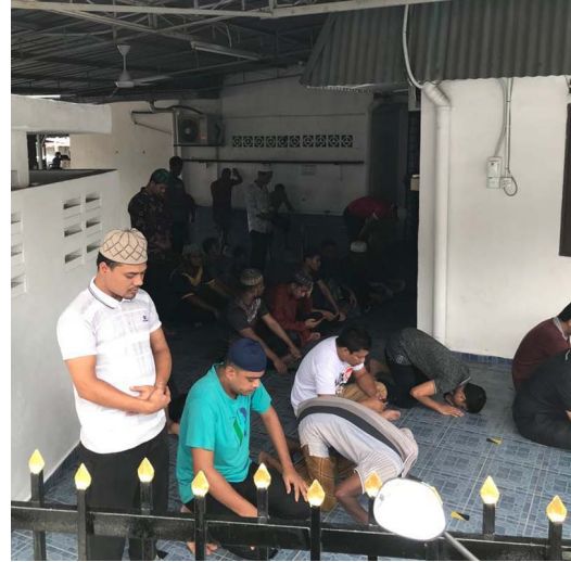
Jemaah solat di hadapan tandas