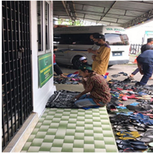
Jemaah solat di kawasan parking