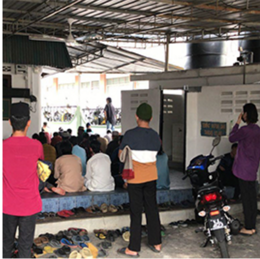
Ruang masjid tidak dapat menampung jemaah masjid yang ramai