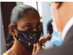
'Keluarga, wang dan media punca masalah'

(/berita/wilayah/2020/07/716727/baju-tulang-manusia-ditemui-di-dalam-perut-buaya)