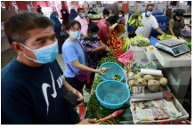
Warga Petaling Jaya patuh pemakaian pelitup muka

( https://www.bharian.com.my/rencana/komentar/2020/08/716863/muafakat-semua-pihak-jayakan-ibadah-korban?utm_source=bh&utm_campaign=recsys&utm_medium=recsys )