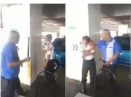
Polis kesan suspek pukul pengawal keselamatan Nepal

(/berita/nasional/2020/07/716762/keluarga-wang-dan-media-punca-masalah)