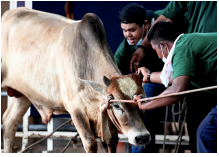
Muafakat semua pihak jayakan ibadah korban

( https://www.bharian.com.my/rencana/komentar/2020/08/716863/muafakat-semua-pihak-jayakan-ibadah-korban?utm_source=bh&utm_campaign=recsys&utm_medium=recsys )