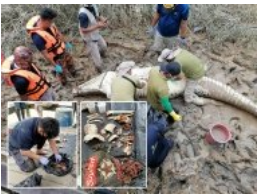
Baju, tulang manusia ditemui di dalam perut buaya

(/hiburan/selebri/2020/07/716669/adibah-jual-rumah-gadai-barang-kemas)