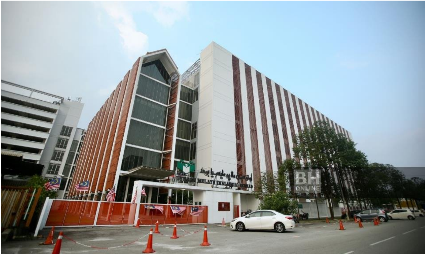
BANGUNAN Utusan Melayu Berhad di Jalan Chan Sow Lin.