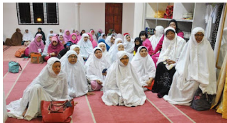
( https://2.bp.blogspot.com/-8ckZhpvm6Hw/VrXkSptbnhl/AAAAAAAAABnQ/ZdWmMKPC_7k/s1600/al%2Bsahadah%2B6.jpg )