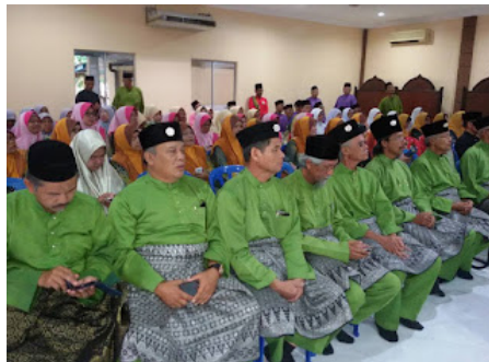
( https://1.bp.blogspot.com/-I21zO631PVI/VrX0bNoLHRI/AAAAAAAABoY/11kSLtJpl-8/s1600/8.jpg )