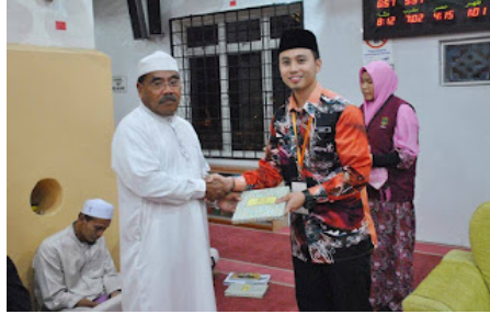
( https://1.bp.blogspot.com/-JDX_3Ehww-M/VrXzfDcrl_I/AAAAAAAAABnw/Obyrzb9COgM/s1600/12.jpg )