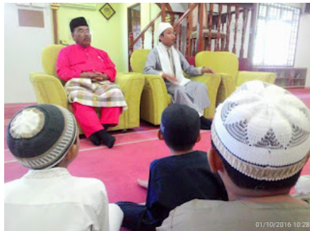
( https://3.bp.blogspot.com/-lonDUWwW5Mo/VrX18CRIIGI/AAAAAAAAABpQ/tbFKtGQId4I/s1600/6.jpg )