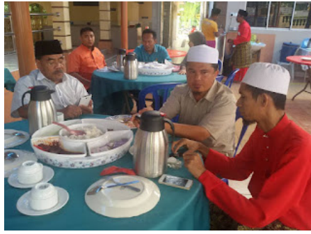
( https://3.bp.blogspot.com/-KOPG22G6Z2g/VrX0aIdGzbl/AAAAAAAABoM/Fp-yXMveeTw/s1600/5.jpg )