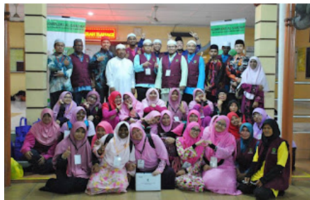
( https://4.bp.blogspot.com/-yzJaqNu2zJQ/VrXkRo6xu2I/AAAAAAAAABnE/FekiCtit_D4/s1600/al%2Bсахadah%2B11.jpg )