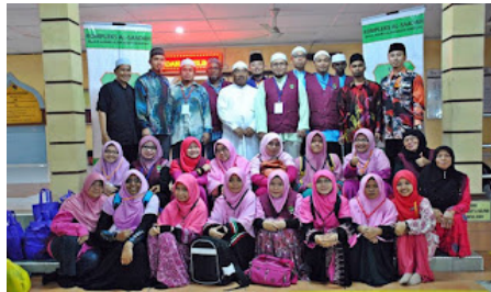
( https://1.bp.blogspot.com/-D127GV2492Y/VrXkReHcCXI/AAAAAAAAABnA/Q-0jWjRwgeM/s1600/al%2Bсахadah%2B10.jpg )