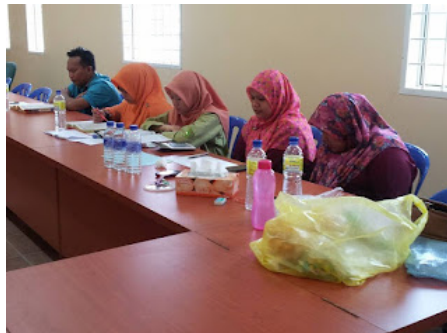
( https://3.bp.blogspot.com/-joQfBm_RbDU/VrX081Kq-xI/AAAAAAAAABok/MEGp0_5HYO8/s1600/3.jpg )