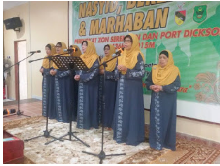
( https://2.bp.blogspot.com/-uhrCYrWYDaY/VrX0YMF1rcI/AAAAAAAAABn4/wxPH-ZdkbTM/s1600/1.jpg )