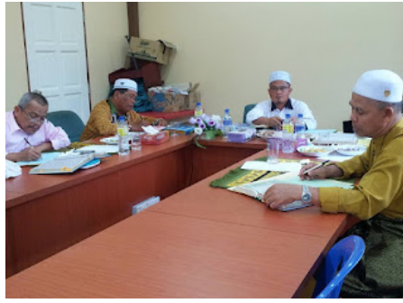
( https://1.bp.blogspot.com/-MHVyHuroYjl/VrX08tZpZAI/AAAAAAAAABoo/ZDXIAqhoOKw/s1600/1.jpg )