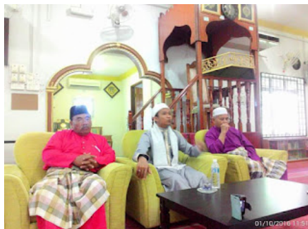
( https://1.bp.blogspot.com/-ka1Pryz67bk/VrX18veDOZI/AAAAAAAAABpU/BiNLBi_9It0/s1600/7.jpg )