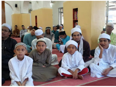
( https://4.bp.blogspot.com/-My39X021rpl/VrX177Lg5UI/AAAAAAAAABpM/YEAUp6Ymt-8/s1600/5.jpg )