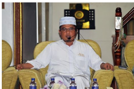
( https://1.bp.blogspot.com/-TlynO-3KP4E/VrXkT5E05ki/AAAAAAAAABnc/_3vm1H9e-0Q/s1600/al%2Bсахadah.jpg )