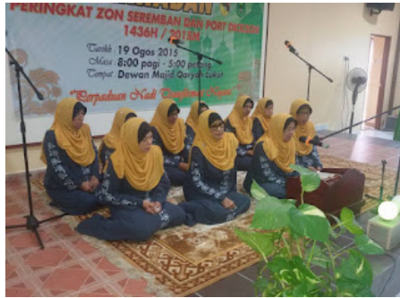
( https://2.bp.blogspot.com/-VgQq2-ZD8BU/VrX0ZM7QOLI/AAAAAAAAABoA/p023CQNNa2s/s1600/2.jpg )