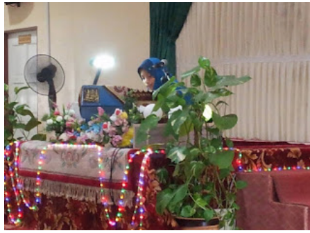
( https://2.bp.blogspot.com/-gKD_iE8qqzo/VrX08r3W8RI/AAAAAAAAABog/ptfk1OYKE3s/s1600/2.jpg )