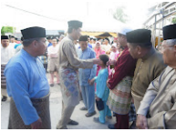
Kunjungan YAB Menteri Besar Negeri Sembilan ke Masjid Qariah Lukut, Majlis Berbuka Puasa.