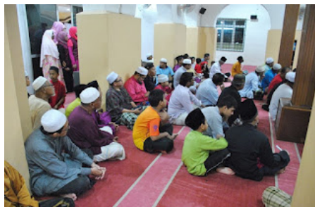
( https://3.bp.blogspot.com/-oInD6jSCf3o/VrXkS74yfxI/AAAAAAAAABnU/HOXbG9YbRP0/s1600/al%2Bsahadah%2B7.jpg )