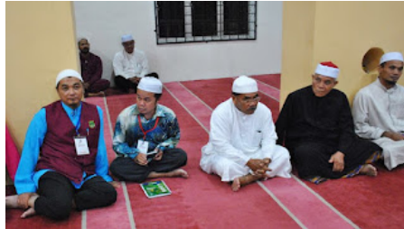
( https://3.bp.blogspot.com/-ysSKlzs8-Dw/VrXkTrvQrJI/AAAAAAAAABng/zloSZZGA40o/s1600/al%2Bсахadah%2B9.jpg )