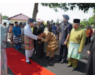
Ketibaan DYMM Sultan Selangor ke Makam Di