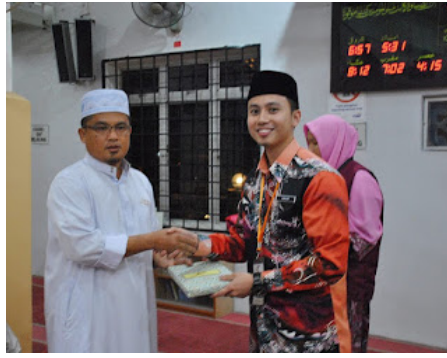
( https://3.bp.blogspot.com/-ZaTUevD9nFc/VrXkRmUngPI/AAAAAAAAABnl/zzetqvSGFWw/s1600/al%2Bsahadah%2B4.jpg )