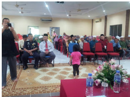
( https://2.bp.blogspot.com/-6NaZxker4XY/VrX1a1205tI/AAAAAAABo0/J0YK02C8te0/s1600/3.jpg )