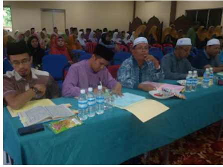
( https://3.bp.blogspot.com/-zT0-MM2N1PM/VrX0aUIlo9I/AAAAAAAABoQ/oWUreyIRtXE/s1600/6.jpg )