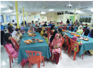
Penyampaian bantuan Hari Raya, dan Berbuka Puasa