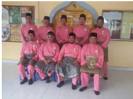
( https://1.bp.blogspot.com/-6GdFCbM_Bdk/VrX0ZUnTGfI/AAAAAAAAABoE/yLuPmU2mhuA/s1600/3.jpg )