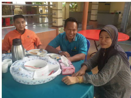
( https://1.bp.blogspot.com/-3FQ69SYhpNs/VrX0ZiAw4OI/AAAAAAAAABol/i4qvTe3aWDg/s1600/4.jpg )