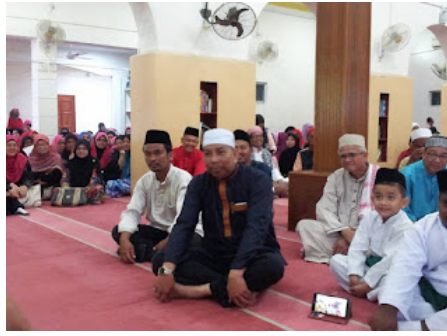
( https://2.bp.blogspot.com/-LOM0T6JC05A/VrX171kdVzI/AAAAAAAAABpI/8n2_sBAqZwI/s1600/4.jpg )