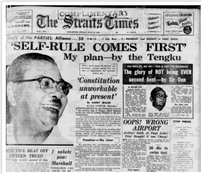
Muka hadapan yang melaporkan kemenangan Perikatan ( TST, 28 Julai 1955)