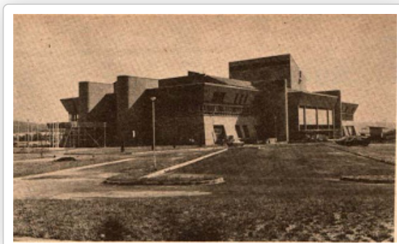
DECTAR dari luar