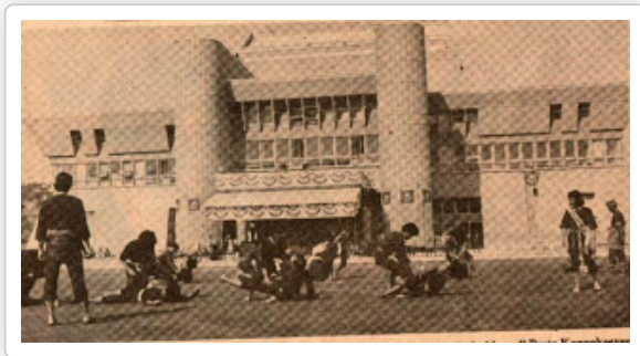
DECTAR sewaktu mula digunakan semasa Konvokesyen UKM ke-6.

Dewan Canselor Tun Abdul Razak (DECTAR) telah siap dibina pada 28 November 1978. Dewan ini telah digunakan buat pertama kalinya pada Majlis Konvokesyen UKM yang ke-6. Pembinaan yang bermula pada 21 Jun 1976 itu telah menelan belanja sebanyak RM6,9222,821. Saiz asal sewaktu siap dibina ialah seluas 153,450 kaki persegi dan merupakan dewan yang terbesar di Malaysia pada ketika itu. DECTAR telah dirasmikan pada 29 September 1979.