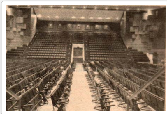
Ruang Dalam DECTAR